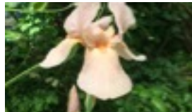
EXEMPEL PÅ: BLOMSTERMÅLERI

DU KOMMER UTÖKA DIN KONTROLL OCH FÄRDIGHET OCH DU KOMMER HA ROLIGT!