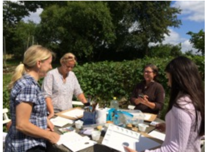
Akvarellkurs på Kulturens Östarp sommaren 2015

Denna akvarellkurs ge dig en bra grund för att komma igång eller gå vidare med akvarellmålning. I akvarellkursen ingår materiallära, materialvård och kompositionsövningar.