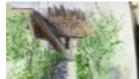
EXEMPEL PÅ MOTIV: LANDSKAP/NATUR