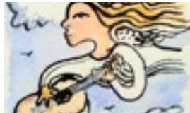
EXEMPEL PÅ STILISERA BLANDTEKNIK